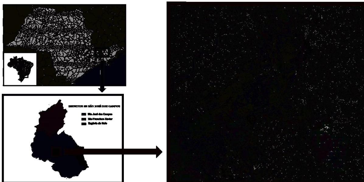
Figura 1 – Localização da área de estudo.

A área de estudo está localizada em uma região que integra uma parte urbana e periurbana (franja urbana) da cidade de São José dos Campos, principal cidade da Região do Vale do Paraíba-SP (Figura 1). A região selecionada possui grande variedade de alvos, tais como: áreas residenciais diversificadas, corpos d'água, solo exposto, áreas rurais de pequenas e grandes propriedades, diversos tipos de vegetação, pavimentação etc., distribuídos num relevo local variando de plano a ondulado.