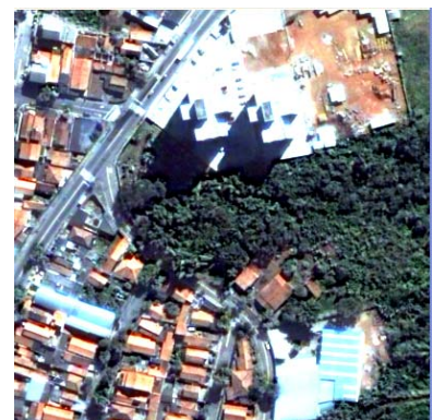
(h) Principais Componentes com 4 bandas