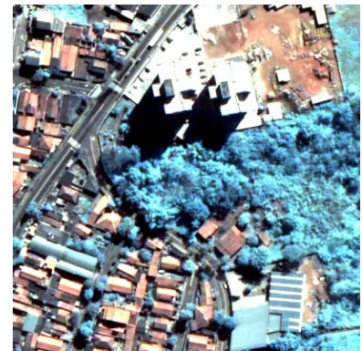
(e) CN Spectral Sharpening com 3 bandas