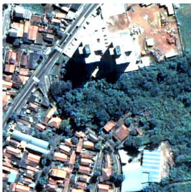
(f) CN Spectral Sharpening com 4 bandas