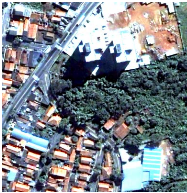
(d) Gram-Schmidt c/4 bandas