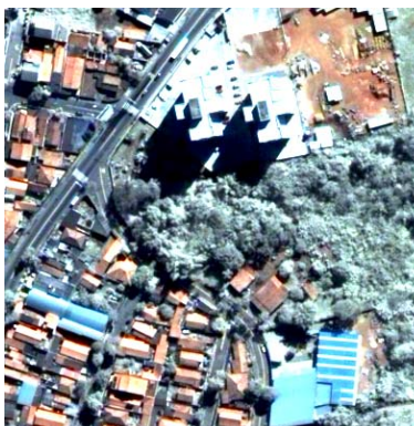
(g) Principais Componentes com 3 bandas