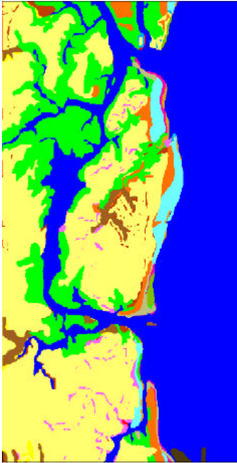
Fig. 3.1 - Mapa de Unidades Básicas de Compartimentação Fisiográfica