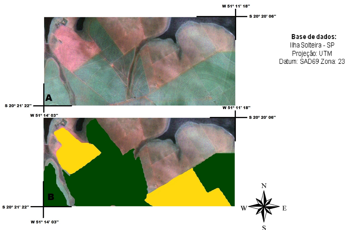
Figura 3. Área de Preservação Permanente: (A) Imagem CBERS fusionada mostrando a APP sem a presença da cana-de-açúcar; (B) Mapeamento do CANASAT, na mesma área recobrando a APP.

Foi observado também que o CANASAT superestima o total de área da cultura da cana-açúcar contabilizando como área ocupada pela cultura algumas áreas de preservação permanente e nascentes, como pode ser visto na Figura 3.