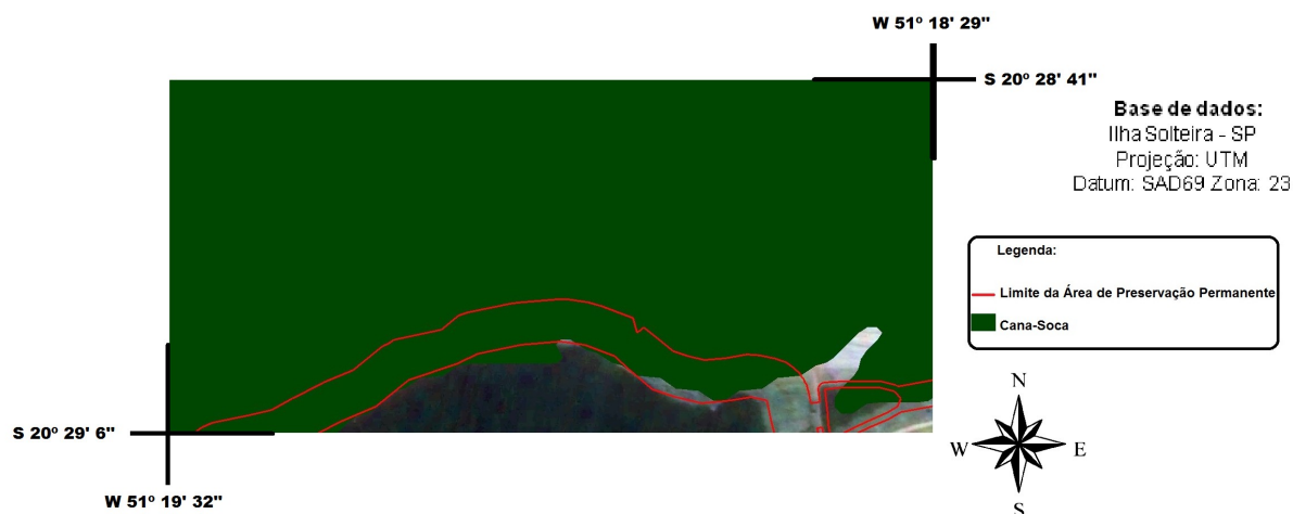
Figura 4. Presença da cultura de cana de açúcar dentro da APP: Mapeamento do CANASAT.