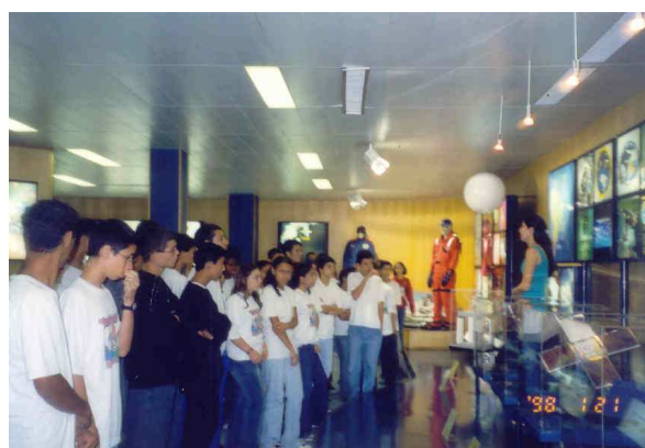
Figuras 4 - Palestras aos Alunos no Centro de Visitantes do INPE.