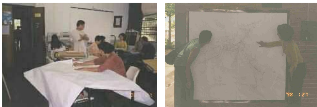
Figura 1. Planejamento do Projeto em Reuniões Pedagógicas (esquerda). Reconhecimento dos Pontos de Visitação no Bairro (direita).

v) Pesquisa de Campo – Realização da “Caminhada pelo Meio Ambiente”, com o interesse de observar e identificar as realidades do bairro e da comunidade em geral. Os alunos receberam um "Diário de Bordo", um guia de orientação que consistia em um convite à observação da natureza e do espaço transformado. Neste guia constavam informações básicas sobre meio ambiente, preservação ambiental, biodiversidade, ecologia, ecossistemas, recursos hídricos, desenvolvimento sustentável, materiais recicláveis, planejamento urbano entre outros. Os alunos tiveram que responder a um questionário, registrando suas percepções em relação às fragilidades e impactos ambientais existentes no bairro. As percepções do "Meio Ambiente Transformado" foram registradas em cartazes, tabelas, gráficos, relatórios, redações, pinturas, colagens, poemas, etc., que foram apresentados em uma exposição na escola.