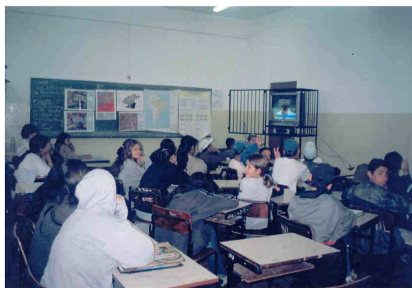
Figura 2 - Aula Introdutória à Sensoriamento Remoto com alunos do Ensino Fundamental.

vi) Diagnóstico Ambiental do Bairro - Grupos de alunos coletaram depoimentos de moradores, que vivem na região há algumas décadas, criando um cenário de como era a