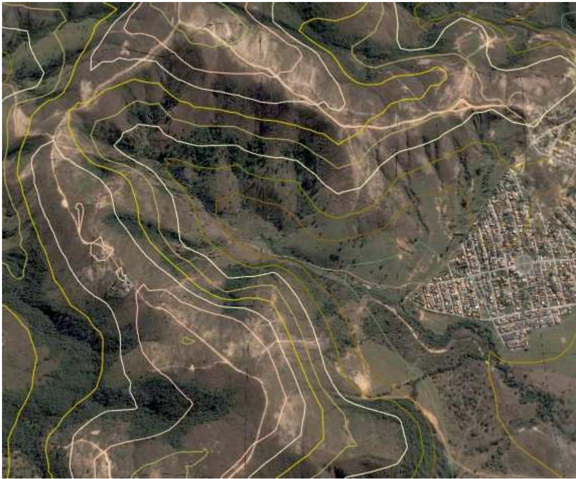
Figura 2. Visualização, no programa Google Earth , de curvas de nível geradas a partir do SRTM-3– Detalhes da Serra Santa Helena, em Sete Lagoas- Minas Gerais.