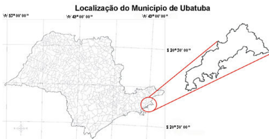
Figura 1: Localização da área de estudo.

O trabalho de Panizza (2004) revela que o fluxo turístico começa a transformar a paisagem em um recurso eminentemente turístico. Entre as décadas de 50 e 80, os eixos rodoviários se consolidam, assim como, as vias de circulação interna das cidades, onde se desenvolvem grandes contingentes de moradias atendendo exclusivamente à atividade turística (fenômeno da segunda residência), ocasionando um ritmo bastante acelerado de urbanização. Este fenômeno atinge ferozmente a população local residente, sendo esta obrigada procurar áreas menos valorizadas pela especulação imobiliária, normalmente em condições precárias.