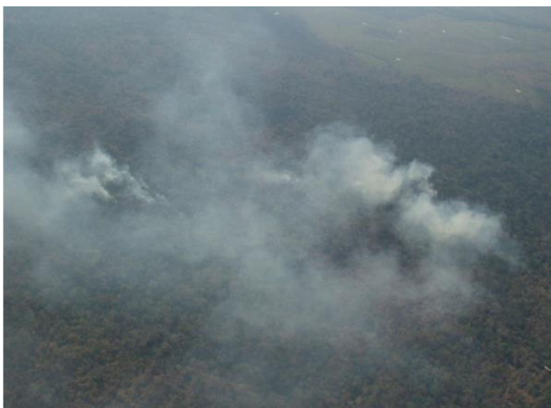
Figura 3. Fotografia aérea de uma queimada em pasto no dia 13 de outubro de 2005. Coordenadas geográficas: 10,934° S e 69,266° W, orientação Norte.