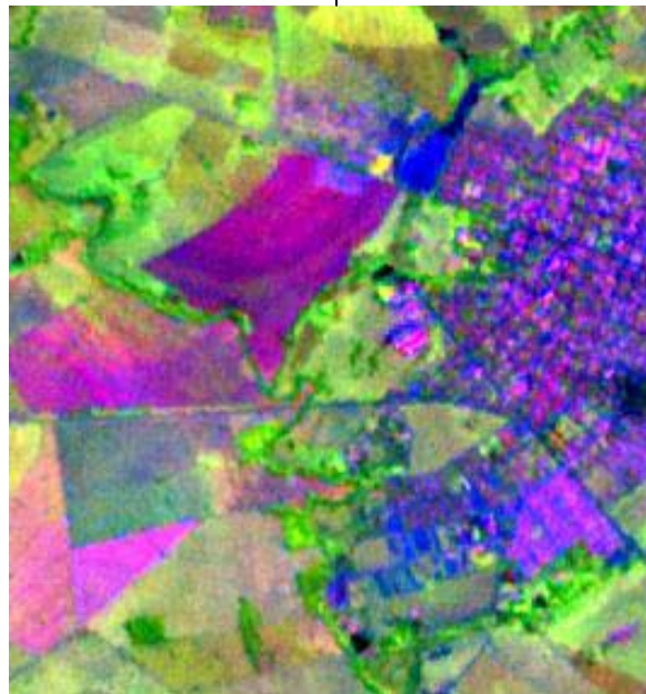
Figura 1: Landsat 7 ETM+ 2003 bandas 543 RGB 30 metros (acima à esquerda), banda pancromática 15 metros (acima à direita) e Fusão pelo método Principal Componente bandas 543 RGB 15 metros (abaixo ao centro).

A reflectância da luz é modelada como o produto de ponto de vetor simples mais o fator de iluminação do ambiente. Para cada pixel , a mudança da direção do terreno nas direções X e Y podem ser computadas a partir de uma janela 3 x 3 centrada sobre cada pixel . Os dois valores são utilizados para computar um vetor representando a unidade normal à superfície naquele ponto. O ponto resultante da unidade normal e do vetor do sol fornece valores que variam de -1.0 até +1.0.