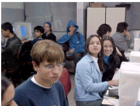
Figura 1 – Turma Geodem em aula no Laboratório de Informática da Escola

A aplicação da metodologia adotada, ocorreu em quatro turmas de duas escolas públicas, com um total de 122 alunos, ao longo de um semestre letivo. A aplicação ocorreu após a capacitação dos professores de geografia envolvidos na pesquisa. Esta capacitação consistiu em familiarizar os professores no acesso e uso do GEODEM, bem como das tecnologias envolvidas no sistema. Foram ministrados os conteúdos às turmas participantes conforme cronograma seguido pelas Turmas Geodem (turmas que utilizaram o GEODEM, Figura 1 ) e Tradicionais (sistema de ensino tradicional, sem o uso da informática). As atividades se desenvolveram durante os horários normais das aulas de geografia nas escolas.