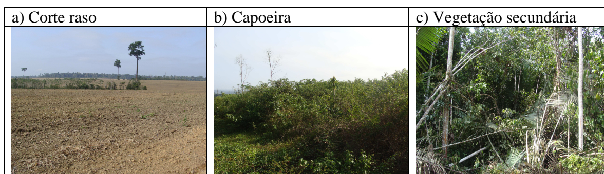
Figura 4 – Fotografias representativas das classes de uso e cobertura da terra na classificação da área interna – trabalho de campo realizado em 20 de janeiro de 2008.

A classe corte raso caracterizou-se pela resposta espectral predominante do solo exposto (Figura 4-a). A classe capoeira foi compreendida como a cobertura vegetal pouco espessa, basicamente composta por arbustos e gramíneas e que, nos dados das imagens de satélite apresentou mistura de resposta espectral do solo e vegetação (Figura 4-b). A classe vegetação secundária, por sua vez, correspondeu à vegetação mais densa, com presença de estrato arbóreo, sobre a qual há predomínio da resposta espectral da vegetação em detrimento da resposta espectral do solo (Figura 4-c).