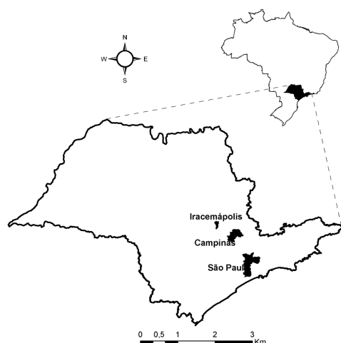
Figura 1. Localização do município de Iracemápolis – SP. Desenvolvido pelo autor.