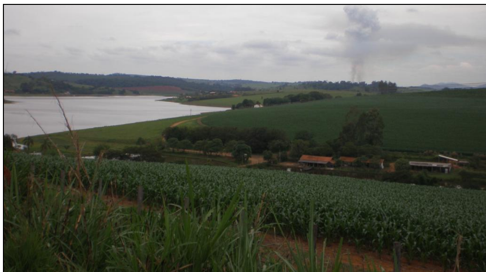
Figura 5 – Cultivos de cana às margens do reservatório de Furnas.

Esse tipo de cultura potencializa os impactos decorrentes ao uso de agrotóxicos e mecanização dos solos, fatores que afetam a qualidade da água e a vida útil do reservatório, devido ao aumento da produção de sedimentos.