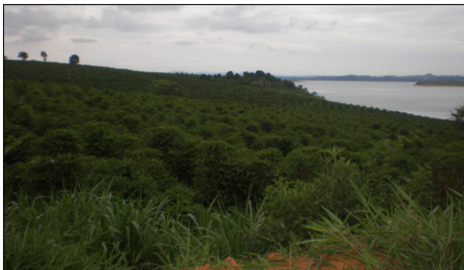
Figura 3 – Os cultivos de café às margens do reservatório de Furnas, nas proximidades do bairro rural Harmonia.

Através da análise do mapa de uso e ocupação da terra (Figura 2), ficou explícito que a forte presença de cultivos agrícolas é o fator mais preocupante e que pode causar um maior número de impactos, principalmente quando localizados nas margens do reservatório. É notável que as matas ciliares foram amplamente substituídas por atividades agrícolas, principalmente as culturas de café e pastagens (Figuras 3 e 4). No entanto, nota-se a grande ocorrência de plantações de cana-de-açúcar, principalmente na região do município de Alfenas e Areado (Figuras 5).