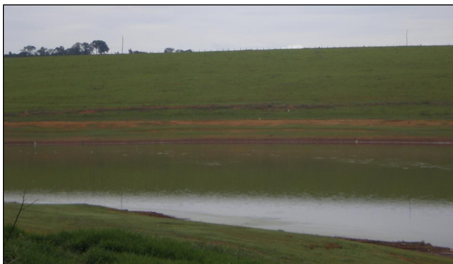
Figura 3 – As pastagens às margens do reservatório de Furnas.