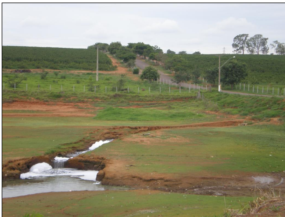
Figura 4 – Lançamento de esgoto doméstico às margens do reservatório de Furnas, nas proximidades do Náutico Clube em Alfenas-MG.

Além das atividades agropastoris, observa-se o uso por meio de pousadas e residências de veraneio ao longo das margens, fatores que contribuem diretamente para a intensificação do processo de poluição do lago através do lançamento de esgoto doméstico (Figura 4).