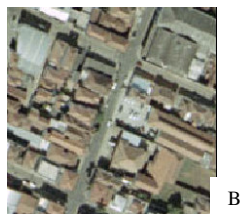
Figura 2 - Morfologia urbana da IC do bairro Paulicéia. Em (A) a imagem termal com destaque para IC, em (B) fotografia aérea mostrando a morfologia urbana.

Na maioria dos estudos urbanos o perfil da IC é o clássico, no qual o centro da cidade caracteriza-se por ser mais quente quando comparado aos demais bairros. No entanto, no Município de Piracicaba, nas análises de inverno, o bairro Centro não teve a IC mais intensa da cidade. Uma das prováveis explicações para esse fato é que cidades de médio e pequeno porte possuem características geográficas bem diferentes das de grande porte. Além disso, foi observado o “efeito oásis”, provocado pelo parque da Rua do Porto (localizado no bairro centro) e pela proximidade do Rio. Nesse caso, o microclima formado pela água do Rio resfria uma parte do ar do centro e, essa camada de ar mais frio, é levada para seus arredores através da ventilação local, provocando uma descontinuidade da IC central e uma conseqüente queda na temperatura.