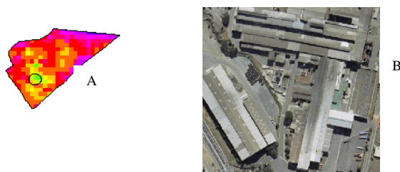
Figura 1- Morfologia urbana da IC do bairro Jardim Primavera. Em (A) a imagem termal com destaque para IC, em (B) fotografia aérea mostrando a morfologia da IC.