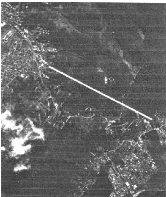
Figura 2: Localização possível túnel de duplicação acesso à Lagoa da Conceição

O túnel de acesso à Lagoa da Conceição (1,4 km), seria alternativa para duplicação da via de acesso até a região de lazer mais conhecida, movimentada e freqüentada por turistas da Ilha. A construção do túnel facilitaria o acesso e evitaria os engarrafamentos constantes. A Figura 7 mostra o trajeto do túnel e os possíveis pontos de emboque do mesmo. O Mapa de Zonas de Fragilidade Estruturais indica para esta região uma zona de alta fragilidade estrutural. Como no caso anterior, esta constatação aponta para necessidade de investigações detalhadas no projeto de obra subterrânea e indica maiores custos, mas não a inviabiliza.