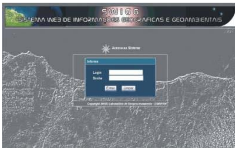
Figura 2 – Página inicial de acesso ao Sistema Web de Informações Geográficas e Geoambientais.

possuem um mesmo conjunto de atributos, e essas geometrias são formadas por um conjunto de elementos (ponto, linha ou polígono). O acesso a estes dados poderá gerar mapas de sensibilidade em escala operacional, garantindo uma melhor eficácia em casos acidentais de derrames de óleo, bem como no planejamento da implementação de novas áreas de exploração petrolífera.