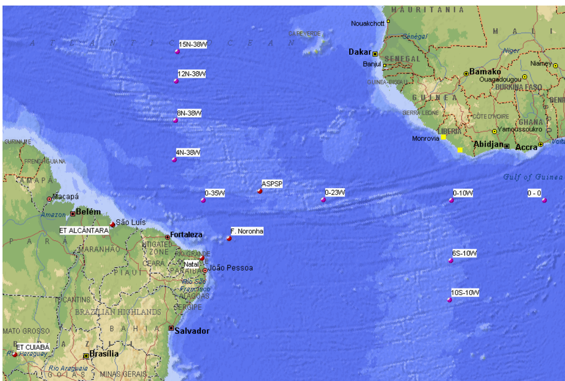
Figura 1 – Localização das bóias PIRATA e estações receptoras SCD-INPE