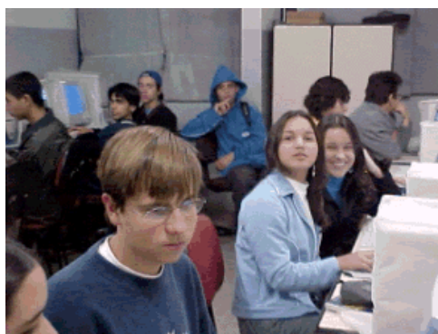
Figura 1 – Turma Geodem em aula no Laboratório de Informática da Escola

A aplicação da metodologia adotada, ocorreu em quatro turmas de duas escolas públicas, com um total de 122 alunos, ao longo de um semestre letivo. A aplicação ocorreu após a capacitação dos professores de geografia envolvidos na pesquisa. Esta capacitação consistiu em familiarizar os professores no acesso e uso do GEODEM, bem como das tecnologias envolvidas no sistema. Foram ministrados os conteúdos às turmas participantes conforme cronograma seguido pelas Turmas Geodem (turmas que utilizaram o GEODEM, Figura 1 ) e Tradicionais (sistema de ensino tradicional, sem o uso da informática). As atividades se desenvolveram durante os horários normais das aulas de geografia nas escolas.