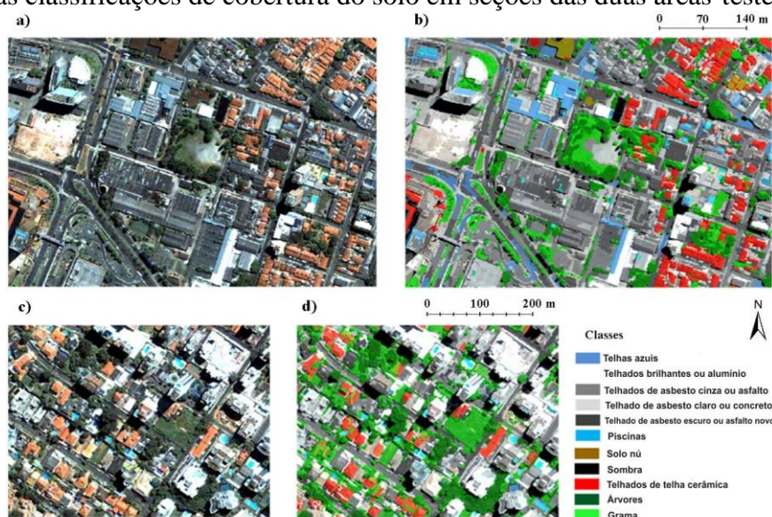
Figura 3. Composições coloridas (a e c) e classificações de cobertura do solo (b e d).

Para a avaliação da precisão das classificações de cobertura do solo, o seguinte procedimento foi seguido. Inicialmente amostras de cada classe de cobertura do solo foram obtidas visualmente a partir da imagem. A maioria dos objetos cuja classe de cobertura do solo pôde ser nitidamente identificada foi amostrada. A seguir a camada vetorial contendo estas amostras foi convertida numa camada raster e o mapa de referencia resultante foi comparado pixel a pixel com as classificações obtidas. A Figura 3 mostra as classificações de cobertura do solo em seções das duas áreas-teste.