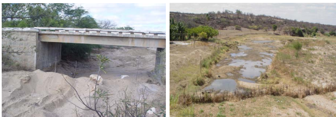
Figura 6. Disposição inadequada do rejeito de caulim e mina abandonada de argila, ambos procedimentos realizados no interior do leito do rio Seridó, com comprometimento da água pela contaminação por elementos radioativos e metais pesados.

Dessa forma, é necessário articular soluções para o crescimento e minimização dos impactos ambientais das atividades minerárias e agrícolas desenvolvidas pelos garimpeiros-agricultores, partindo do pressuposto que é impossível mudar as condições naturais do semiárido, mas é possível desenvolver atividades econômicas rentáveis e de acordo com a dinâmica da semiaridez, quando se privilegiam as suas potencialidades em harmonia com a gestão ambiental, ao contrário que tem sido feito historicamente. Assim, é essencial quebrar o paradigma que as irregularidades da distribuição espaço-temporal das precipitações são