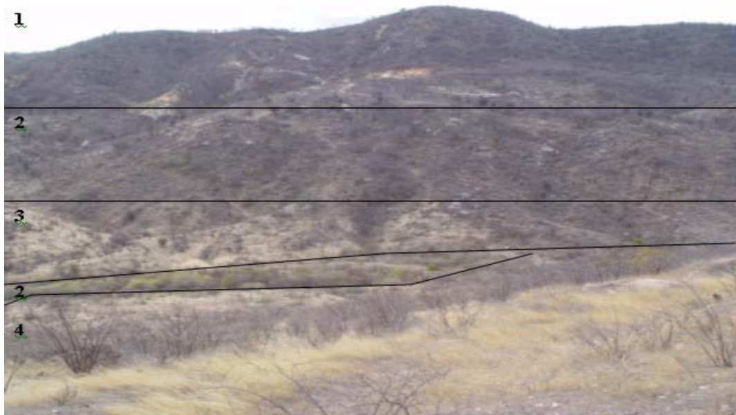
Figura 3. Savana-Estéptica Florestada (1); Savana-Estéptica Arborizada (2); Savana-Estéptica Parque (3) e Savana-Estéptica Gramíneo-Lenhosa (4).

devida recuperação ambiental. Esse descompromisso com o meio ambiente desencadeia os processos erosivos, de assoreamento e de contaminação dos cursos d'água. Esses processos se intensificam pelo desmatamento de novas áreas para a exploração mineral e plantio, como também pela continuidade da disposição inadequada dos rejeitos das minas, geralmente nas estradas, encostas, interior das calhas dos rios e ao redor das represas.