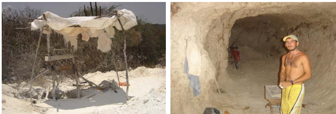
Figura 4. Estrutura rústica para a entrada dos garimpeiros nas minas subterrâneas e garimpeiro sem proteção no interior da cava subterrânea, condições que facilitam os acidentes.