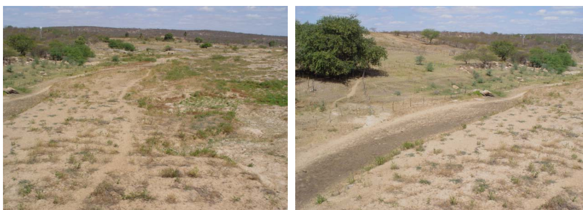
Figura 5. Abandono de áreas agrícolas sem recuperação ao redor do leito seco do rio Seridó, com feições erosivas lineares na forma de sulco, com tendência a formar ravinas.