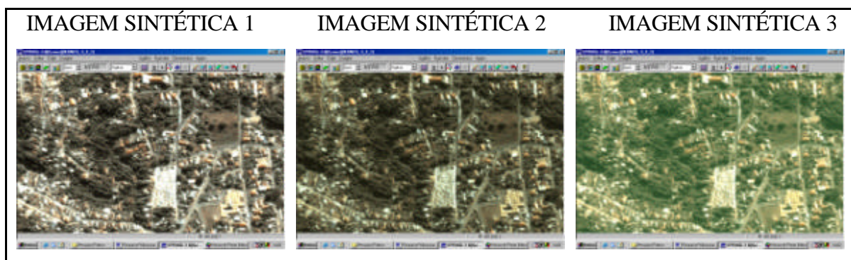
Figura 3: Amostra das Imagens Sintéticas

O passo subsequente foi a construção da chave de interpretação das imagens do satélite IKONOS da área de estudo que, devido a alta resolução do produto orbital, foi possível utilizar o método e as técnicas de interpretação visual de fotos aéreas trabalhando-se na escala aproximada de 1:3.000. Buscou-se nas imagens, alvos ou objetos que normalmente já fazem parte das descrições dos perímetros dos setores censitários, através de consulta ao Manual de Atualização de Bases Cartográficas para Coleta do Censo 2000 IBGE (1998) e Mapoteca Topográfica Digital IBGE (2002).