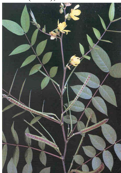
Figura 2 – Folhas de Cassia macranthera

Já a espécie Ligustrum japonicum Thunb. ( Figura 3 ) é uma espécie que ocorre naturalmente no Japão e nas Coreias (Sul e Norte), tendo sido introduzida no país por imigrantes japoneses para arborização urbana e rural, não sendo encontrada em formações naturais no Brasil. Possui dispersão autocórica ou zoocórica, e ponto de compensação luminoso baixo, características que, se fossem utilizadas para sua classificação, segundo Budowski (1965), a classificariam como uma espécie climáceas.