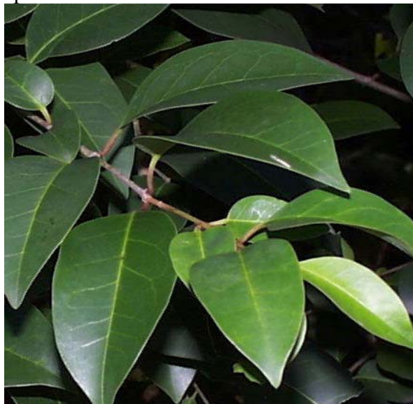
Figura 3 – Folhas de Ligustrum japonicum

As amostras foram posicionadas em uma esfera integradora acoplada ao espectrorradiômetro Spectron SE-590 (que mede 252 faixas espectrais estreitas, entre 368,4 a 1113,7 nm) e iluminadas por uma fonte de luz halógena, de modo com que fossem medidas as radiâncias refletidas e transmitidas pelas amostras, que posteriormente foram convertidas,