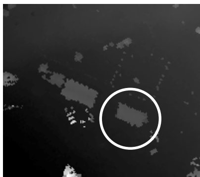
Figura 1 – Prédio do Laboratório de Meteorologia

Foi selecionado o prédio do Laboratório de Meteorologia da Universidade Federal do Paraná, no campus do Centro Politécnico, no bairro Jardim das Américas, devido estar bem definido na imagem altimétrica ( Figura 1 ), derivada dos dados laser scanner e por ser uma construção com geometrias bem definidas para o cálculo do volume através do método topográfico.