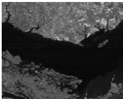
Figura 2 - Exemplo de dado de sensoriamento remoto (imagem LANDSAT de Manaus)